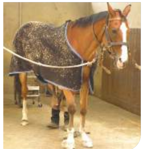
Visite du Cadre Noir à Saumur