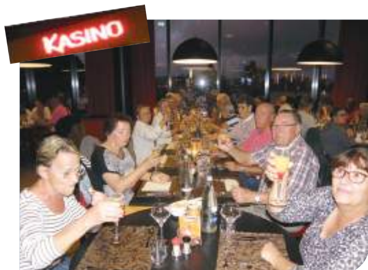
Dîner au « Kasino »