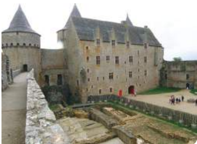
Château de Suscinio