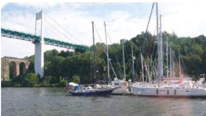
Croisière déjeuner sur la vilaine