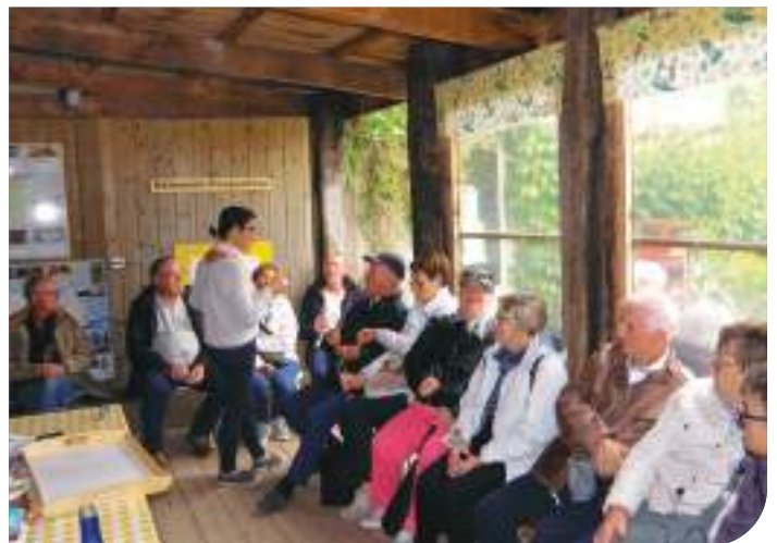
Visite du Musée du Cidre suivi de la dégustation