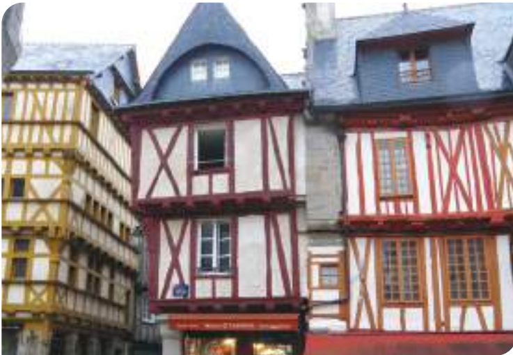
Visite commentée de Vannes à bord du petit train