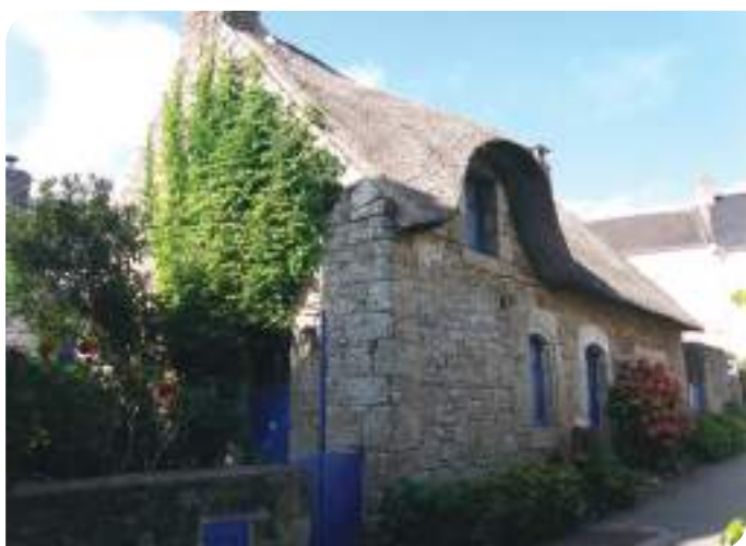
Visite de l'Île aux Moines