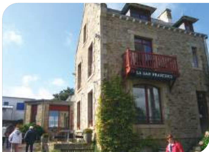
Déjeuner au San Francisco