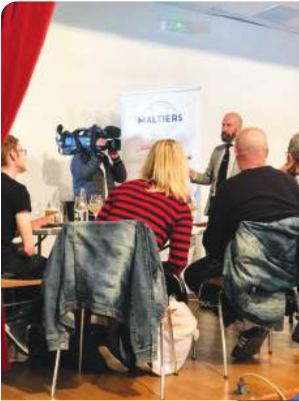
Le Diors Bière Festival a rassemblé près de 3000 personnes qui ont pu découvrir l'univers de la Bière artisanale sur la journée du 1 er Mai.