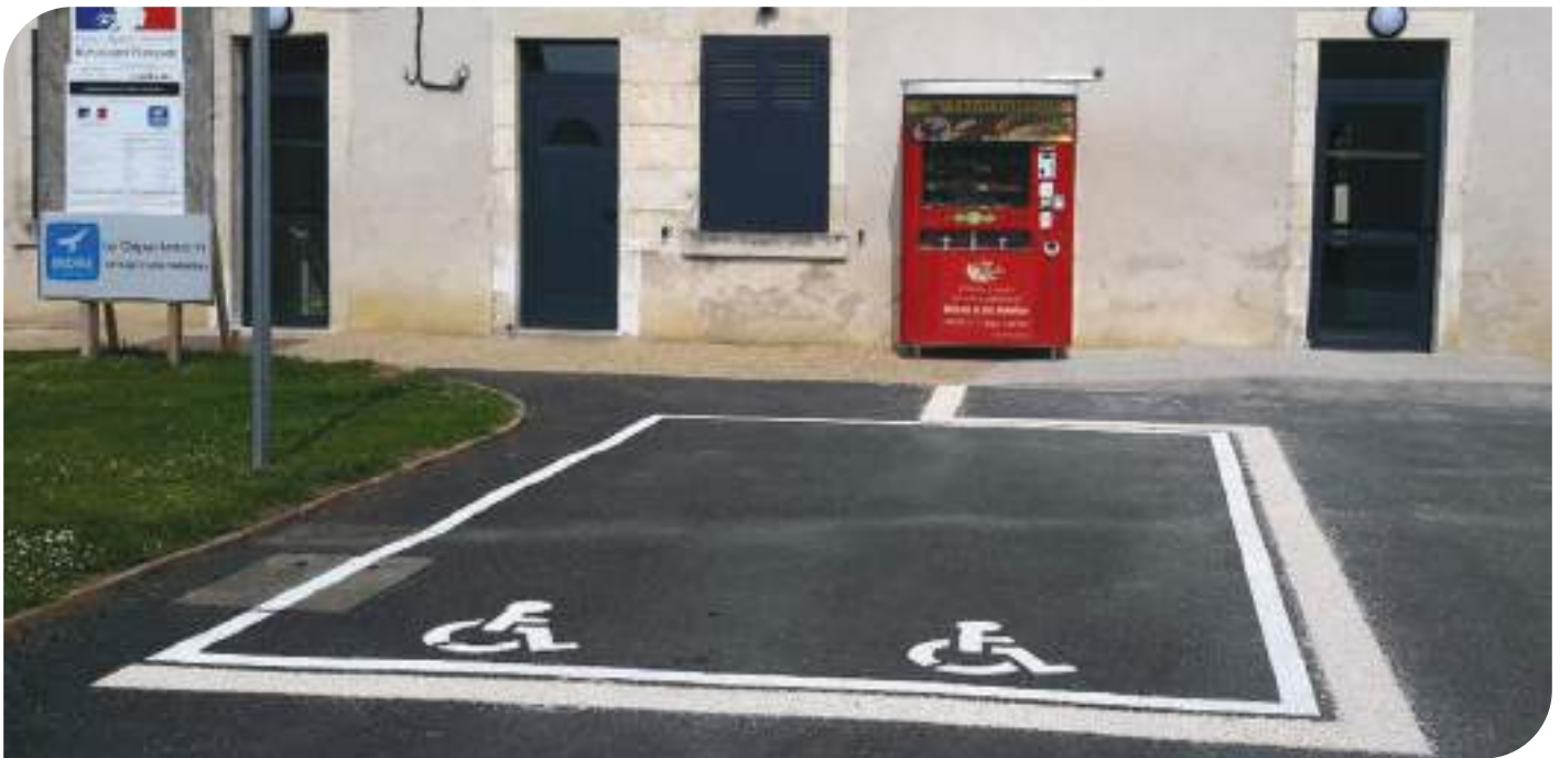
Une place handicapée a été créée sur le parking.

Voici la nouvelle maison des associations rénovée, subventionnée par le département :