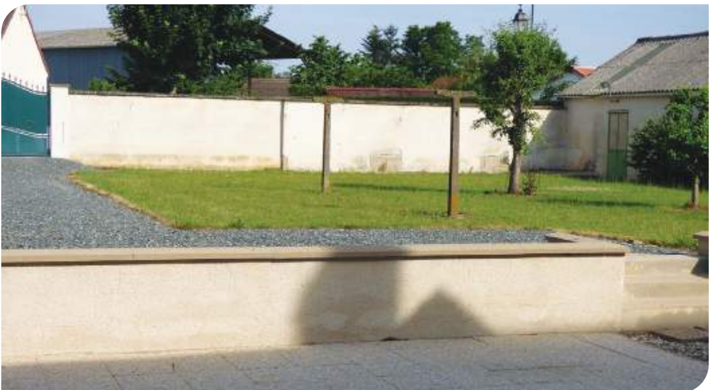
La terrasse sur l'arrière.