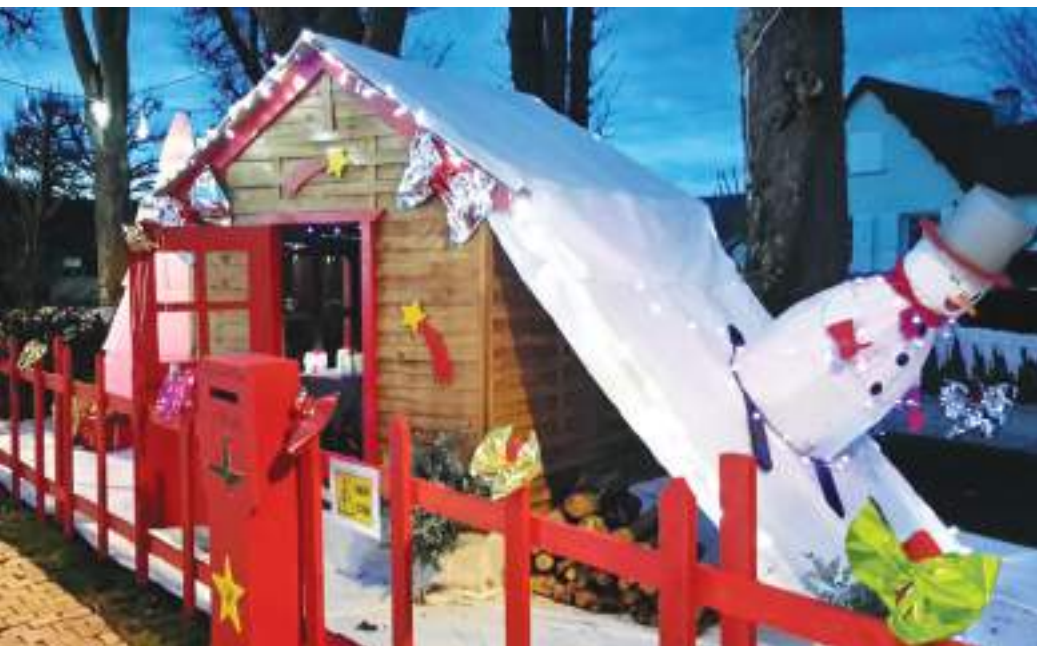
Le Chalet du Père Noël

C'est, sous des yeux ébahis que petits et grands ont pu admirer les magnifiques décorations de Noël créées et installées sur la place de la Mairie par nos sympathiques agents de la commune que nous remercions.