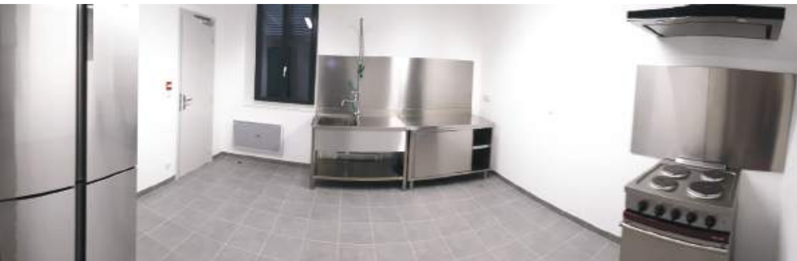
Création d'une nouvelle cuisine.