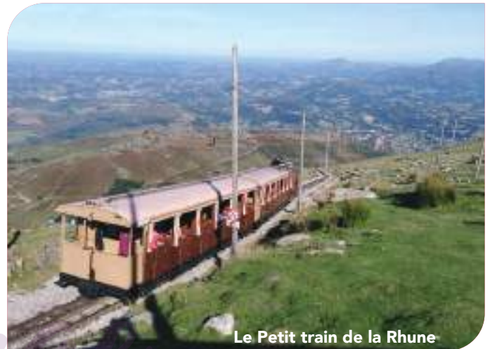
Le Petit train de la Rhune