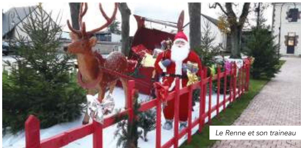
Le Renne et son traineau