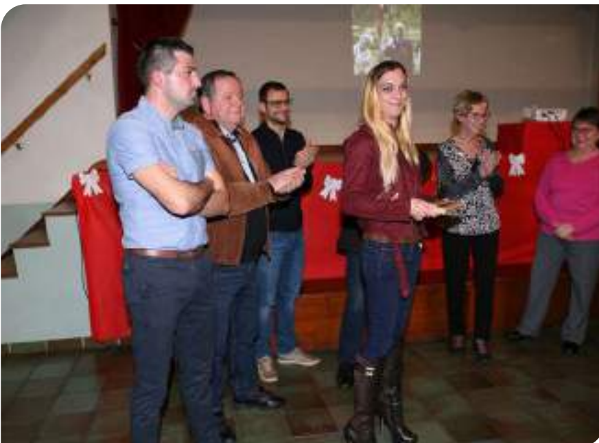
La « Feuille d'or » a été remise par le jury départemental fin 2017 pour le fleurissement de la commune.