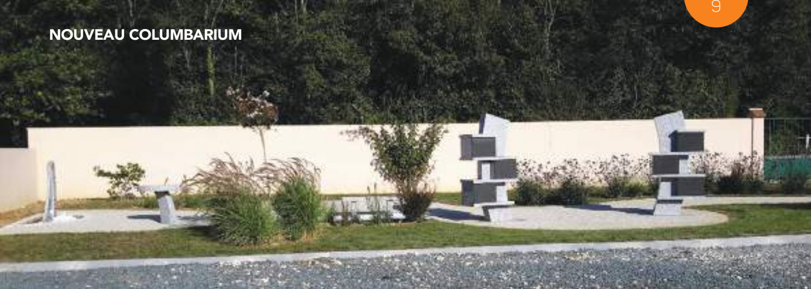
État du MUR DU CIMETIÈRE.