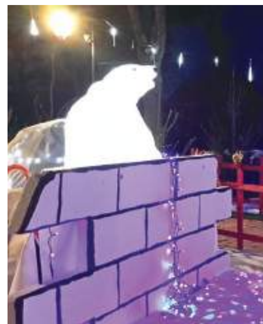
L'Ours polaire sur la banquise