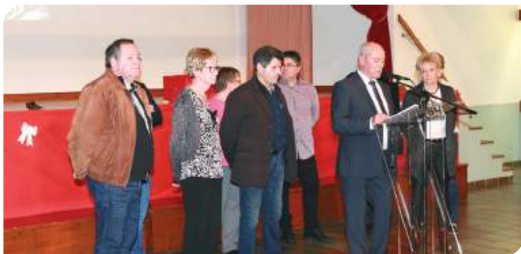
Mr le Maire, adjoints et conseillers, lors du discours annuel.