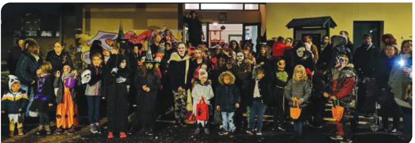
Nouveau succès pour Halloween, Chasse aux bonbons réussie, Festival en augmentation. Tous les ingrédients sont réunis pour une bonne édition 2019 !