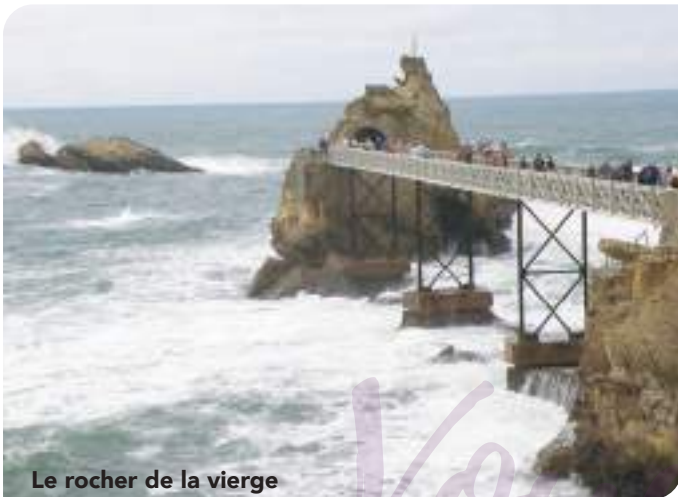
Le rocher de la vierge