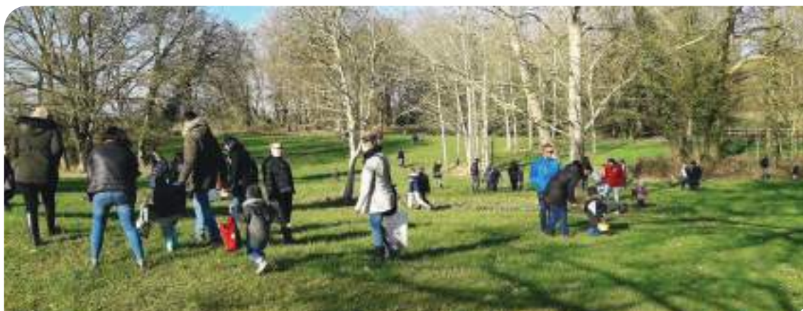
La chasse aux oeufs de Pâques a rassemblé plusieurs dizaines de parents et d'enfants dans le parc du Château de Diors à l'occasion du Dimanche de Pâques.