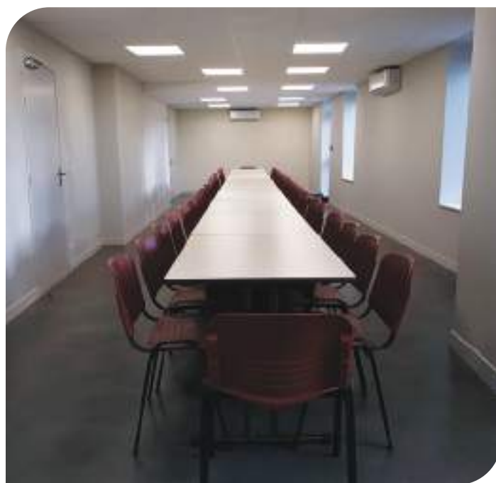
La salle de réception.