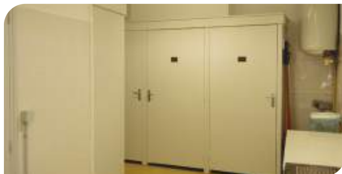
Lieu de stockage mis à disposition des associations.